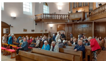
Culte ensemble EDV 2023